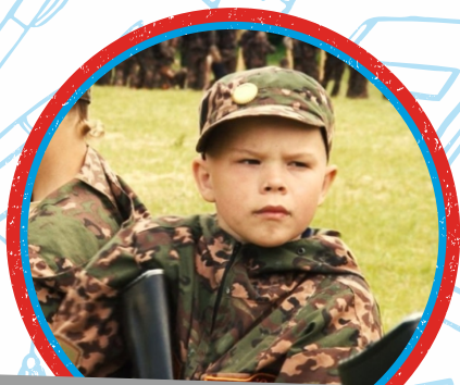
ЮНЫЙ СПЕЦНАЗ НАЦГВАРДИИ