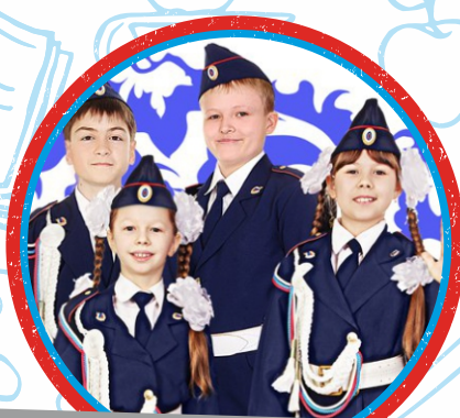
ЮНЫЕ ИНСПЕКТОРА ДВИЖЕНИЯ