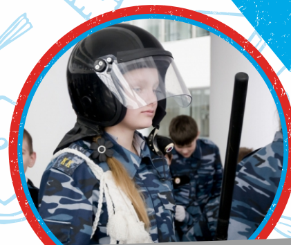
ЮНЫЕ ДРУЗЬЯ ПОЛИЦИИ